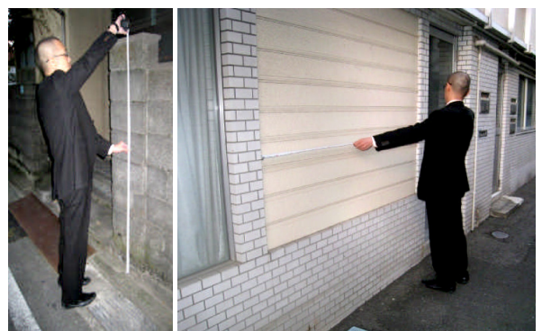
■ 家屋調査のご案内 ■ 調査のイメージ